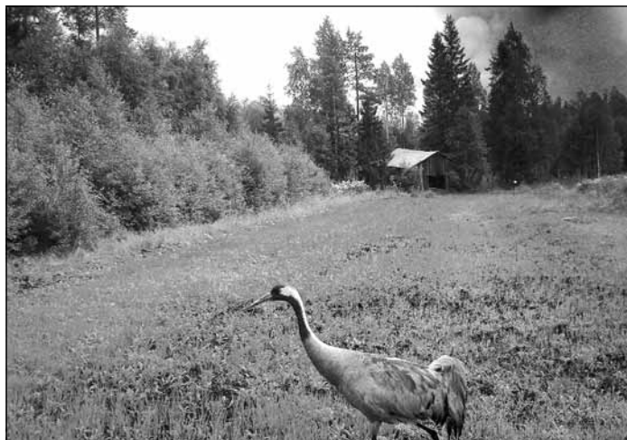
Yllätysvieras riistakamerassa. Joissain kuvissa näkyi koko perhe, mutta kuvien laatu oli heikko.