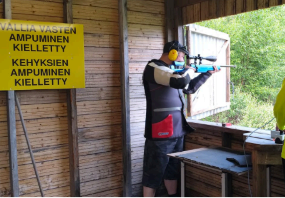
PIENPETOPYYNTI HAUKIPUTAAN RHY