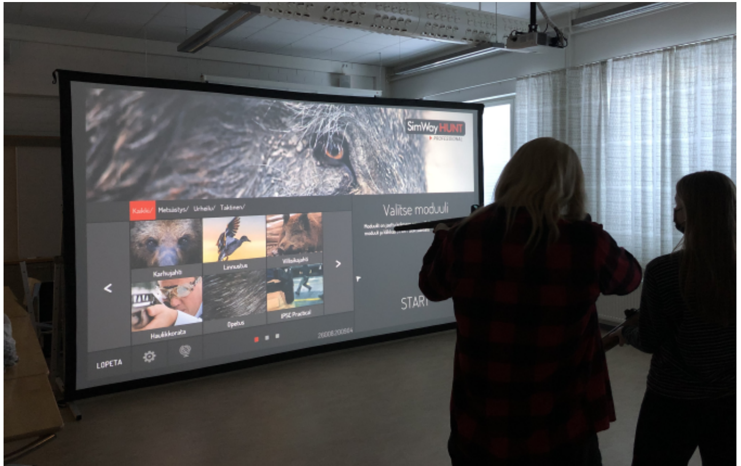
Riistanhoitoyhdistys järjesti yhdessä JMS:n ja KMS:n kanssa simulaattoriammunnat Haukiputaan lukiolla.

Puheenjohtaja päätti kokouksen klo 19.33.