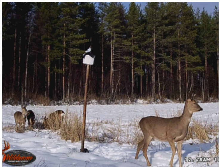
Metsäkaurisnaaras ja kolmoisvasat.