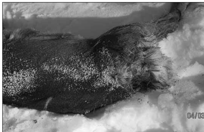
Koiran raatelema kauris. Kuva Martti Järvinen.