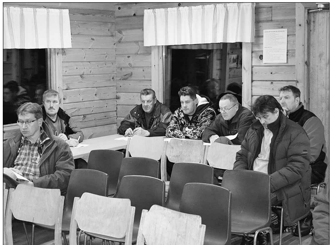
Tilaa oli vielä KMS:n vuosikokouksessa.

Talousarvio on laadittu 35 euron jäsenmaksun mukaan. Seuran taloudellista valmiutta parannetaan tehostamalla tarvikeostamista ja mikäli hirvikanta sallii, järjestämällä hirvenliihaukkauppatilaisuus.