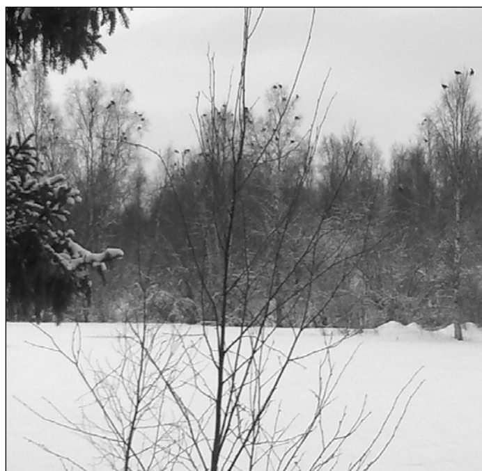
Teeriä noin sata. Kaikki eivät mahdu kuvaan.

RHY järjestää etupiirinsä metsästäjille odotetut PIENPETOPÄIVÄT 24.–25.3.2012 klo 12:00 Kalimen radalla